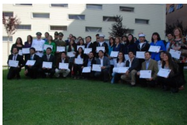
Cincuenta jóvenes de la Región del Biobío fueron reconocidos como Líderes del Sur.