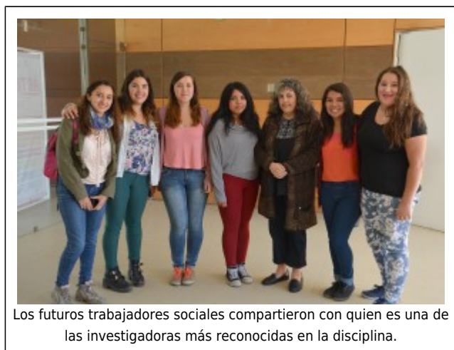
Los futuros trabajadores sociales compartieron con quien es una de las investigadoras más reconocidas en la disciplina.

En su análisis subrayó que “son los jóvenes quienes están vinculados a la tecnología, pero están iniciando una tarea de aprendizaje en lo social y probablemente ellos serán la generación que permita resignificar el mundo social en el mundo virtual y aprovechar el potencial de estas tecnologías tanto en la comunicación como en el conocimiento, pero también en las lógicas de intervención de futuro, pudiendo existir una reconceptualización profesional”.