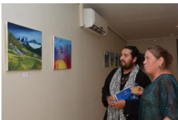
la Sala Schäfer.

Universidad de Chile (Detuch), el jueves 26, a las 19,30 horas; y “Pequeña historia de Chile”, del Teatro Universidad del Bío-Bío, el viernes 27, a las 19, 30 horas. Todas las funciones tendrán lugar en