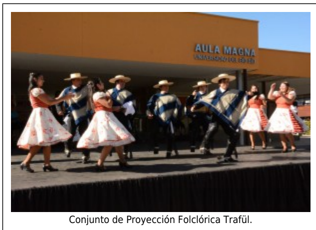
Conjunto de Proyección Folclórica Trafül.