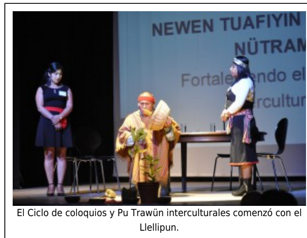
El Ciclo de coloquios y Pu Trawün interculturales comenzó con el Llellipun.

Con el tema Medios de comunicación regional y el tratamiento informativo sobre interculturalidad y pueblos originarios. ¿En qué estamos y hacia dónde vamos? se dio inicio al Ciclo de coloquios y Pu Trawün interculturales: Biobío, frontera histórica de la diversidad étnica, pueblos originarios y cultura, organizado por la Corporación Mapuche Enama, Artistas del Acero y la Universidad del Bío-Bío.