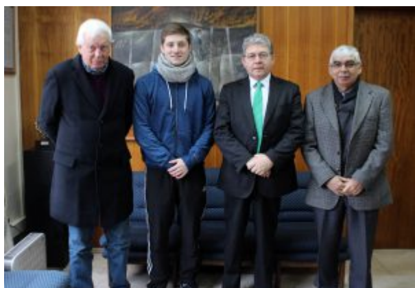
NOMINA DEPORTISTAS SELECCIONADOS EN ATLETISMO

Con una marca de siete metros con sesenta y tres centímetros clasificó el deportista que compitió recientemente en el campeonato sudamericano, que se efectuó en Paraguay donde representó al país en la selección adulta, quien comienza a enfocarse netamente en lo que será el Mundial Universitario. “Tengo un mes para prepararme, ahora estoy terminando mis ramos en la Universidad, pues estamos en término de semestre, pero luego me centraré sólo en entrenar para el mundial, pues la competencia será potente, pero estoy feliz de representar a Chile y a la Universidad”.