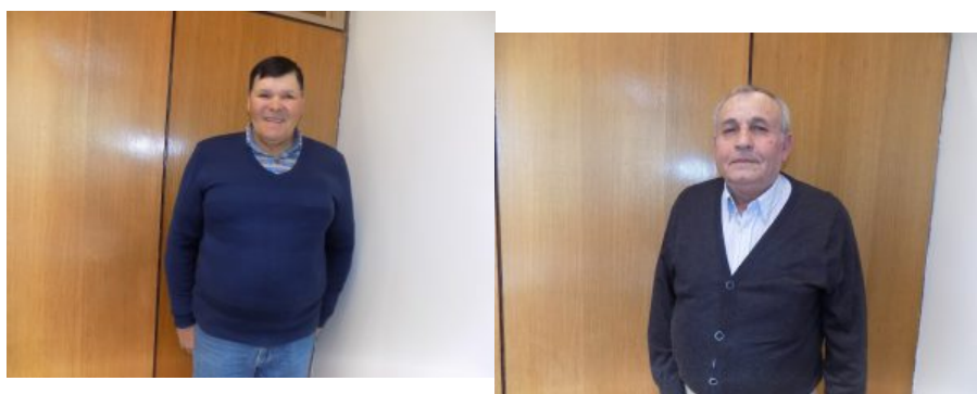
Estudiantes de guitarra del Conservatorio UBB encantaron con recital