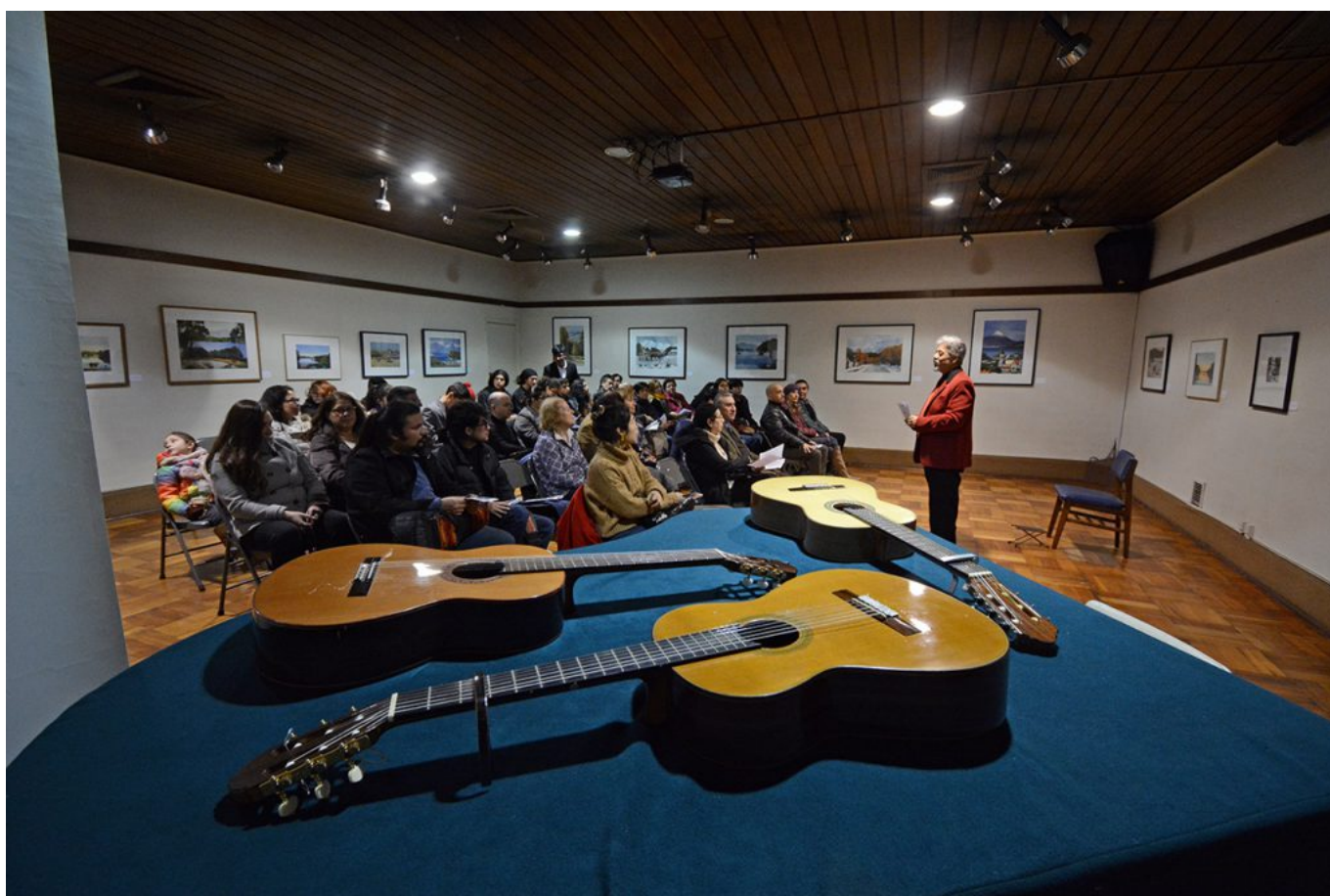
Los alumnos de guitarra clásica del Conservatorio de Música Laurencia Contreras de la