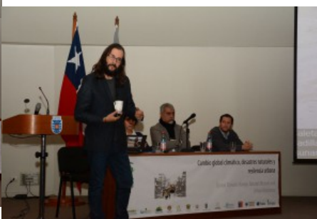
SE MINARIO CIUDAD EN TRANSFORMACION ( IVAN CARTES ) 5-X-2015