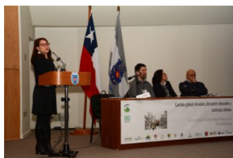
SE MINARIO CIUDAD EN TRANSFORMACION ( IVAN CARTES ) 5-X-2015