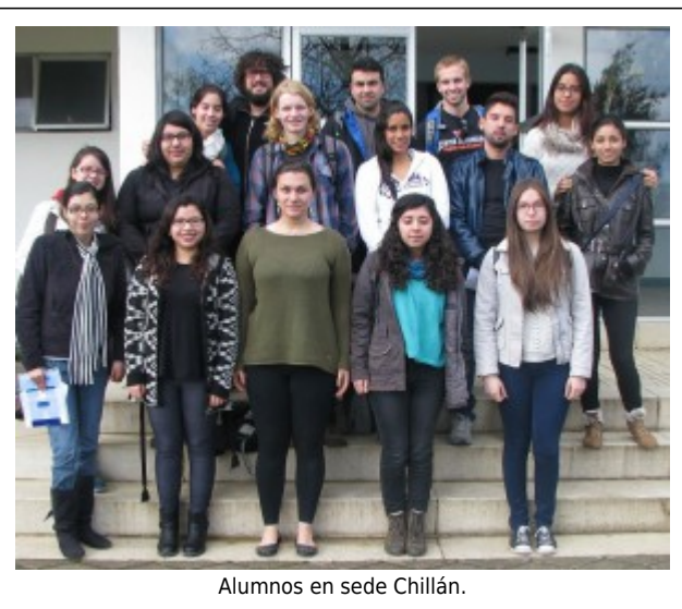
Alumnos en sede Chillán.

Una jornada de inducción a los 25 alumnos extranjeros que realizan sus estudios en nuestra Universidad durante el segundo semestre académico 2014, organizó la Dirección General de Relaciones Institucionales a través de su Oficina de Movilidad Estudiantil, el 28 y 29 de julio, en las sedes Concepción y Chillán, respectivamente.