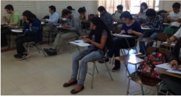
Cerca de 40 alumnos rindieron el examen TOEIC.