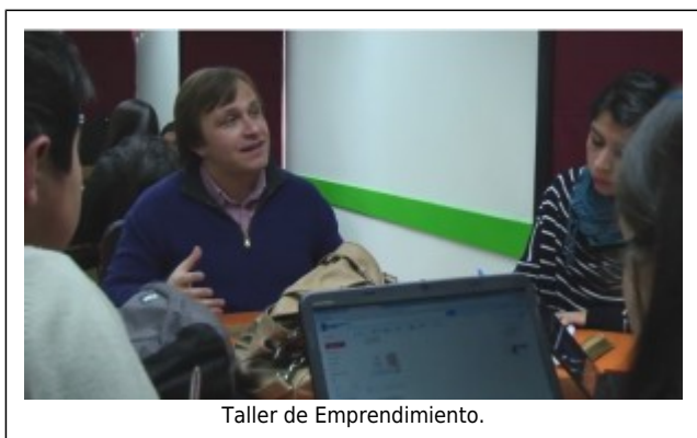
Taller de Emprendimiento.

Trabajo en equipo y Emprendimiento fueron las dos líneas de los talleres que dictó la Unidad de Formación Integral a más de un centenar de estudiantes de las sedes Concepción y Chillán, respectivamente.