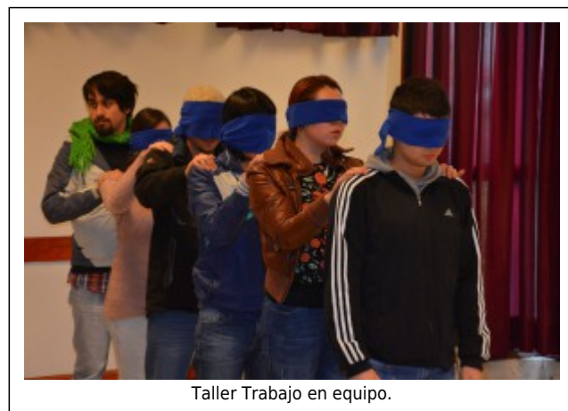
Taller Trabajo en equipo.

Tras cuatro sesiones realizadas los días sábado en ambas líneas, los alumnos destacaron la contribución al desarrollo personal y profesional que brindan los talleres.