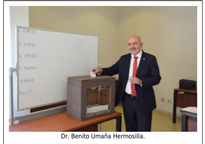
Dr. Benito Umaña Hermosilla.

La declaración de los resultados provisorios de la votación, tras la calificación formal del proceso, se llevó a cabo el jueves 12 de julio, habiendo plazo hasta el martes 17 para presentar objeciones. La declaración de los resultados definitivos será el lunes 23.